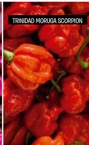
TRINIDAD MORUGA SCORPION